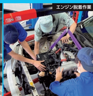
エンジン脱着作業