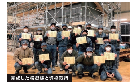
完成した模擬棟と資格取得

木造住宅の大工職を中心として、家づくりの知識と技能を活かした仕事で活躍しています。