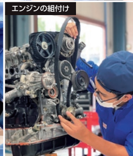
エンジンの組付け