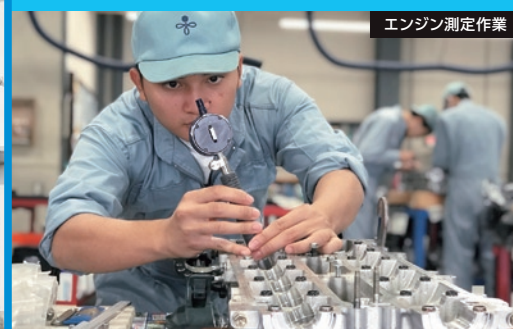
エンジン測定作業