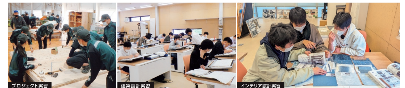
プロジェクト実習