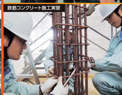
鉄筋コンクリート施工実習